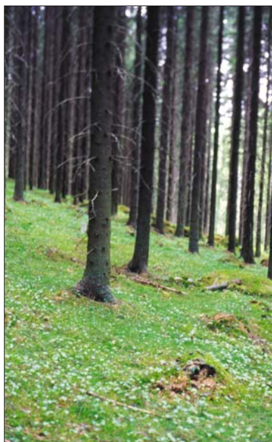
Фото 1. В плодородном ельнике первостепенным критерием возобновления является полнота древостоя. На фото изображены 80-тилетние культуры ели на участке концерна UPM-Куттене.

На соответствующих по плодородию торфяных почвах применяются те же показатели среднего диаметра и возраста при отводе древостоя в рубку возобновления. Если всё-таки рост насаждения значительно замедлен, рубку назначают независимо от показателей возраста и крупности.