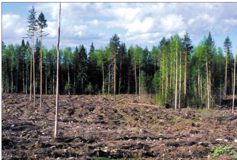
Фото 4. В современных условиях лесное хозяйство предусматривает сохранение на участке возобновления одиночных деревьев и древесных групп с подростом.

Для сохранения ландшафтного и биологического разнообразия при рубке возобновления можно оставлять мёртвый или живой древостой. На восстанавливаемой площади сохранению подлежат лиственные деревья благородных пород, одиночные старовозрастные крупные осины, ивы ( S. carnea ), берёзы или образованные ими группы, гнилые деревья или даже годные к дорастиванию группы деревьев. Перечисленные деревья или кусты не считаются помехой для создания молодняка (Фото 4).