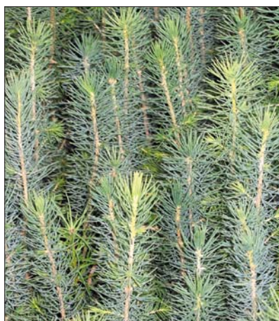
Фото 5. На основании номера паспорта (EY/FIN) можно идентифицировать партию семян и саженцев при выращивании вплоть до посадки в лесу.