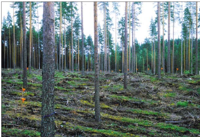
Фото 3. Успешному естественному возобновлению предшествует, как правило, обработка почвы. На фотографии изображен участок с семенниками сосны в Юпайоки.

При естественном возобновлении делают по необходимости обработку почвы, оставляют достаточное количество семенников на территории или на границе участка возобновления (Фото 3.). Также проводят расчистку от трав, злаков и поросли и другие мероприятия по уходу за молодняком.