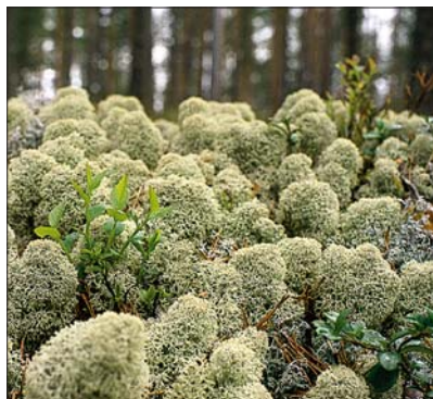
Фото 2. Закон о лесе обеспечивает безопасность лесовосстановления на охраняемых территориях без сокращения границ лесов. На фотографии новое поколение сосен в Аксуярви, 250 м. над ур. моря.

Рубками возобновления могут быть: сплошная рубка с последующим проведением лесокультурных работ, вырубка семенников и верхнего защитного полога с целью содействия естественному восстановлению или каёмчатая рубка. Также закон разрешает проводить рубки другим способом, предусмотренным в данном исключительном случае, если восстанавливаемый участок имеет особый статус в связи с охраной биоразнообразия, ландшафта или традиций недревесного пользования лесом. Рубки и сопутствующие им мероприятия должны выполняться так, чтобы избежать повреждений деревьев на лесосеке и в примыкающем древостое. Кроме этого должны быть учтены факторы отрицательного влияния на рост древостоя при повреждении лесной почвы.