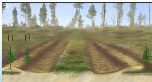
Bracke T26.b формирует посадочные места с перевёрнутым дёрном (Т), холмики из минеральной почвы на перевёрнутом дёрне (Н) и холмики из минерального грунта на минеральной почве (М).