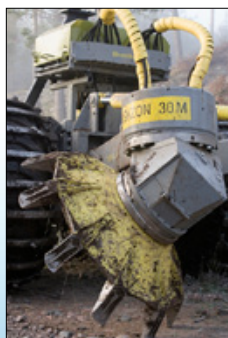
Диски и сменные зубья.