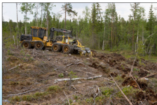
Bracke T26.b устанавливается на базовых машинах среднего и большого размера.