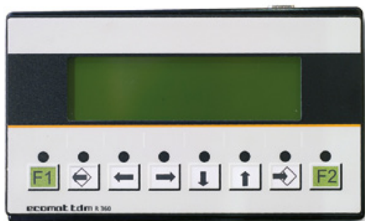
Bracke Growth Control - это система управления, основанная на программируемом логическом контроллере PLC.

S35.a устанавливается на культиваторах для одновременной с обработкой подачи семян. Семена подаются через шланги на посевную борозду. Индивидуальные подающие колёса контролируют поток семян на каждый посевной канал.