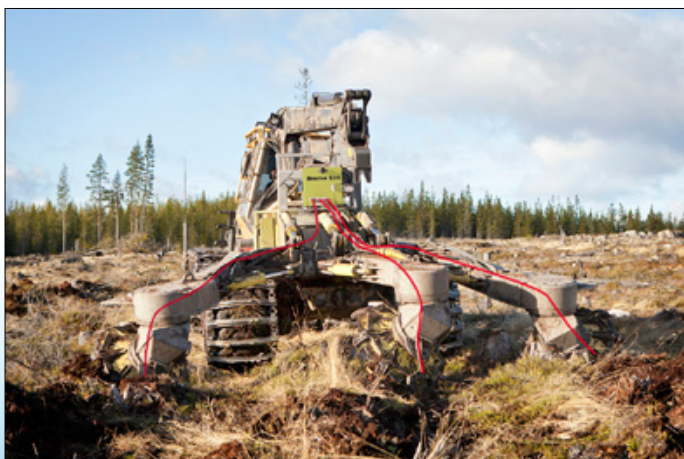
Bracke S35.a может устанавливаться на двух и трёхрядных культиваторах.

S35.a устанавливается на культиваторах для одновременной с обработкой подачи семян. Семена подаются через шланги на посевную борозду. Индивидуальные подающие колёса контролируют поток семян на каждый посевной канал.